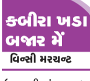
કબીરા ખસા ભજર મેં વિન્સી મરચન્ટ

ફાઈનાન્સિયલ ઓફિસરને એ રકમનું મહત્વ ન સમજાયું તે આશ્ચર્યજનક છે. આપણે નથી કહેતા કે ઓફિસરના ઈરાદા ખરાબ હતા. પરંતુ ફોન કરીને શેઠને જણાવવું જોઈએ કે આટલી રકમ ટ્રાન્સફર કરી છે. કાં પછી કંપની પાસે અઢળક પૈસો હશે એટલે આવા વહેવારો રોજબરોજના હશે. પરંતુ તેમ પણ લાગતું નથી. જો એમ જ હોય તો ગુજરાલ-પુત્રીએ વહેવારોને ગંભીરતાથી લીધા તેમ લીધા ન હોત. એણે તત્કાળ પિતાને જાણ કરી પગલાં લીધાં. ૧૬ જુનના રોજ પોલીસમાં એકઆઈઆર નોંધાવવામાં આવી. તપાસમાં જણાયું કે અત્યાર સુધીમાં છેતરપિંડીની કુલ રકમ સાત કરોડ અડસઠ લાખ રૂપિયામાં ચાર કરોડ અઢવાળ લાખ જુદી જુદી બેન્કોના એકાઉન્ટ્સમાં હોલ રાખવામાં આવી છે. જે ખાતાઓમાં ટ્રાન્સફર કરવાની હતી તેમાં કરાઈ ન હતી. વહેવાર એક ઠગાઈનું પરિણામ હોઈ શકે તેમ માનીને બેન્કો જલ્દી રકમ ચૂકવી દેતી નથી.