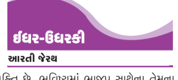
ઈદર-ઈદરકી આરતી જેચ

કરવા માંગતા હતા અને બંને દેશો વચ્ચેના સામાન્ય સાંસ્કૃતિક સંબંધો પર ભાર મૂકવા માંગતા હતા. તેમણે કહ્યું કે બે દેશો સાથે મળીને કામ કરે, તો ભારત અને બાંગ્લાદેશ એક શક્તિશાળી બની શકે છે અને એક અગ્રણી વૈશ્વિક ખેલાડી બની શકે છે. જોકે, આરએસએસ દ્વારા પાકિસ્તાન, બાંગ્લાદેશ અને ભારતના પ્રાચીન અખંડ ભારતને એક રાષ્ટ્ર તરીકે ફરીથી બનાવવાની વારંવારની મહત્વાકાંક્ષાને ધ્યાનમાં રાખીને, ત્રિવેદી પીછાં ફરડાટમાં મુકાયા. સ્વાભાવિક છે કે, બાંગ્લાદેશના વિરોધી પક્ષો ટાકા અને નવી દિલ્લી વચ્ચે ફાટ નાખવા અને સંબંધોને સામાન્ય બનાવવાથી રોકવાની કોઈ તક ગુમાવશે નહીં. ત્રિવેદી મોટી સરકારના વિદેશી રાષ્ટ્રદૂત તરીકે નિયુક્ત થયેલા પ્રથમ રાજકીય વ્યક્તિ છે. ભવિષ્યમાં ભાષ્ય સાથેના તેમના સંબંધોને કારણે તેમણે પોતાના શબ્દો વધુ કાળજીપૂર્વક પસંદ કરવા પડશે. તેઓ નિયમિત વિદેશ સેવા અધિકારી નથી. ભારત અને બાંગ્લાદેશ વચ્ચેના દ્વિપક્ષીય સંબંધો હાલમાં નાજુક છે કારણ કે બંને સરકારો ભૂતપૂર્વ વડા પ્રધાન શેખ હસીનાની હકાલપટ્ટી પછી થયેલા નુકસાનને સુધારવા માંગે છે, જેમને નવી દિલ્લીની ખૂબ નજીક માનવામાં આવતી હતી.