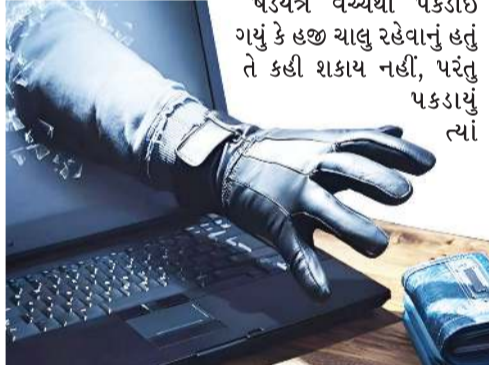
પડયંત્ર વચ્ચેથી પકડાઈ ગયું કે હજી ચાલુ રહેવાનું હતું તે કહી શકાય નહીં, પરંતુ પકડાયું ત્યાં