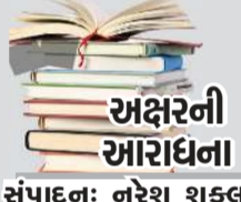
અક્ષરની આરાધના સંપાદન: નરેશ શુક્લ

ખૂબ મૂલ્યવાન હોય એમ મુક્તક નાની કૃતિ હોય છે પણ મોટી અસર ઊભી કરે છે. (લેખ- કિરણસિંહ ચૌહાણ) આ ગ્રંથમાં મુક્તક શતક છે. એટલે કે રાજન ભટ્ટે સૌ મુક્તક સમાવ્યાં છે. ભારતમાં મુક્તકોની પરંપરા જૂની છે. ચાર પદની, છ પદની નાનકડી રચનાઓ એકદમ ઘણા ઝબકાર કરીને ભાવકચિતને આલોકિત કરે છે. મુક્તકો વર્ણનાત્મક હોય, ક્યારેક કશુંક દટાંત રૂપ કરે, જીવનમર્મનો સ્કોટ કરનારી આવી પદ્યકલિકાઓ આપણાં ચિત્ત પર અસર કરનારી હોય છે. અવગીચ સમયગાળો શરૂ થયો એ ગાળામાં હડવા, પાંચિકડા જેવા લઘુરૂપોમાં કટાક્ષ, નર્મ-નર્મ