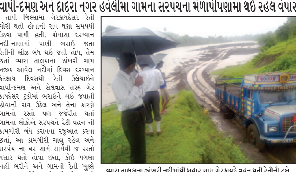
વ્યારા તાલુકાના ઝાંખરી નદીમાંથી બહાર ગામ ગેરકાયદેસર રેતી ચોરી કરતી ટ્રકો

(ગુજરાતમિત્રના પ્રતિનિધિ દ્વારા) વ્યારા : વ્યારા તાલુકાના ઝાંખરી ગામ પાસેથી પસાર થતી ઝાંખરી નદીમાં બહારના ઈસમો દ્વારા મોટા પાયે ગામના વાપી-દમણ અને દાદરા નગર હવેલીમાં ગામના સરપંચના મેળાપીપણામાં થઈ રહેલ વેપાર તાપી જિલ્લામાં ગેરકાયદેસર રેતી ચોરી થતી હોવાની રાવ ઘણા સમયથી ઉઠવા પામી હતી. ચોમાસા દરમિયાન નદી-નાણામાં પાણી ભરાઈ જતા રેતીની ઊંડા ભંધ થઈ જતી હોય, તેમ છતાં વ્યારા તાલુકાના ઝાંખરી ગામ નજીક આવેલ નદીમાં દિવસ દરમિયાન કેટલાય દિવસથી રેતી ઉલેચાઈને વાપી-દમણ અને સેલવાસ તરફ ગેર કાયદેસર ટ્રકોમાં ભરાઈને લઈ જવાતી હોવાની રાવ ઉઠેલ અને તેના કારણે ગામનો રસ્તો પણ જઈતી થતાં ગામના લોકોએ સરપંચને રેતી વહન ની કામગીરી બંધ કરાવવા રજૂઆત કરવા છતાં, આ કામગીરી ચાલુ રહેલ અને સરપંચ ના ઘર સામે સામથી જ રસ્તો પસાર થતો હોવા છતાં, કોઈ પગલાં નહીં ભરીને અને ગામની રેતી ખુલ્લે આમ ભરાઈને જતી હોવાને કારણે નિવાસી કલેક્ટર ભદ્રે રેતી ચોરીની ફરિયાદ મળી હતી. જેને પગલે વ્યારા મામલતદારને સૂચના આપતા તેઓ ભરવસાદે ખાણ ખનીજ ખાતાના અધિકારીને લઈ રેડ કરી હતી. જેમાં રેતી ભરવા લાઈનમાં ઉભેલી દમણ સાઈટની ચાર ખાલી ટ્રક અને એક રેતી ભરી ઓવરલોડ કારવમાં ફસાયેલ ટ્રક ઝડપી પાડી હતી. અને કાયદાકીય કાર્યવાહી હાથ ધરવા વ્યારા કચેરીએ ટ્રકોને લાવવામાં આવી હતી. કેટલાક દિવસથી આ ટ્રકો દ્વારા રેતી ચોરી કરાઈ રહી હોવાથી લાખો રૂપિયાની રોકાણનો કટકો પડ્યો છે. ત્યારે આ બે નંબરમાં રેતી ચોરીનો ધંધો કરાવનારા